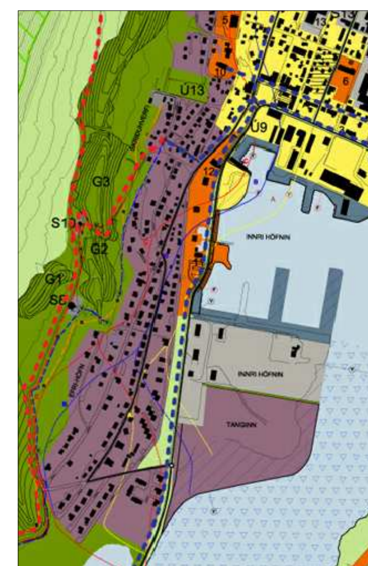
Adalskipulag Fjallabyggðar 2008-2028