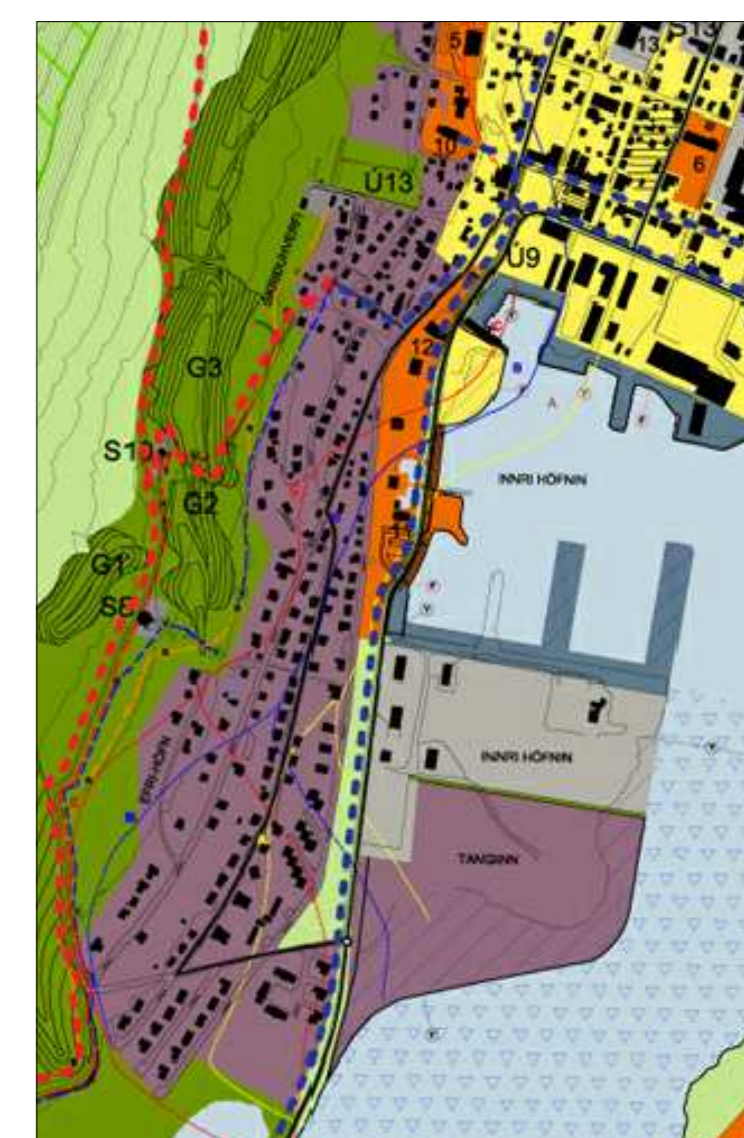
Adalskipulag Fjallabyggðar 2008-2028